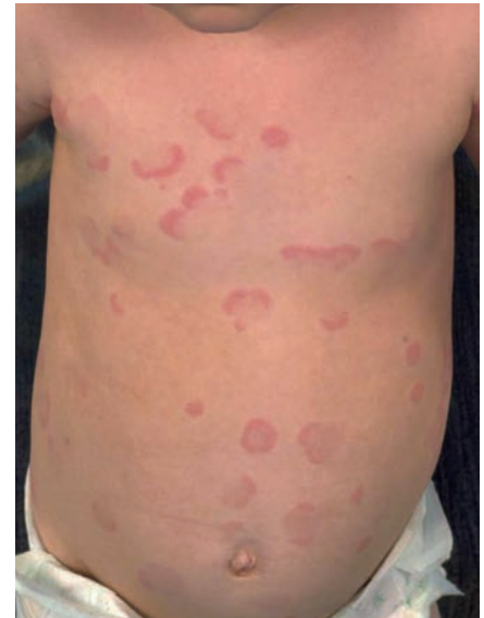
Akute Urtikaria bei einem Kleinkind.

z. B. durch Hautkontakt mit Brennnesseln oder Quallen.