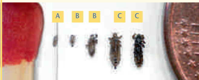
Для сравнения: спичка / 1-центовая монета

... проходит различные стадии от яйца через стадию личинки до взрослой, половозрелой особи. Яйца, хитиновые оболочки которых также называют гнидами (A), откладываются самкой у кожи головы и приклеиваются к волосам водостойким веществом. Через 8–10 дней после кладки из яиц вылупляются личинки (B). За 9–11 дней они превращаются во взрослые половозрелые особи (C) – и цикл начинается заново.